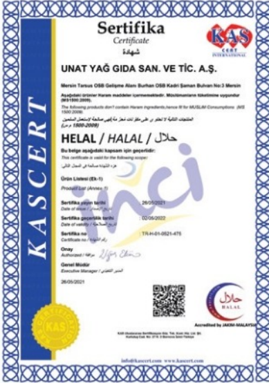
Helal Gıda Belgesi (Halal Food Certificate)