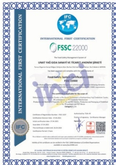
FSSC 22000 Gıda Güvenliği Belgesi (Food Safety Certificate)