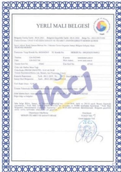
Yerli Malı Belgesi (Domestic Goods Certificate)