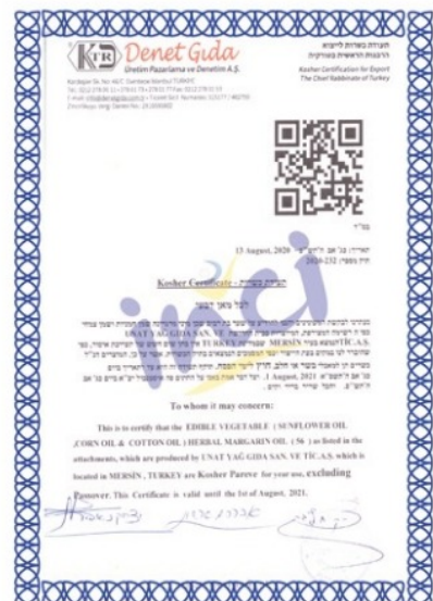
Kosher Belgesi (Kosher Certificate)