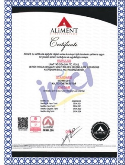
ISO 9001: 2015 Kalite Yönetim Sistemi Belgesi (Quality Management System Certificate)